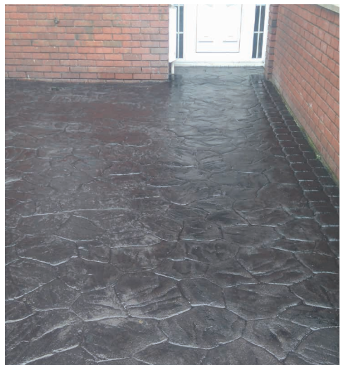
Reconstitution permanente sur béton matricé.