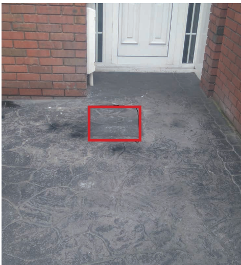
Reconstitution temporaire sur béton matricé.

Si les zones de pelouse sont endommagées quand on fait la tranchée, notre équipe s'efforcera de les réparer, même de ressemer si nécessaire. La remise en état des platebandes et de la pelouse peut être retardée selon les conditions météo.