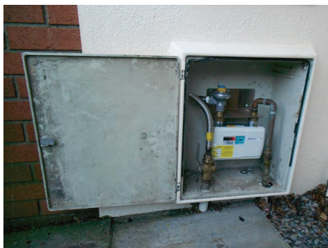
Le compteur et la zone l'entourant avant le renouvellement des services.