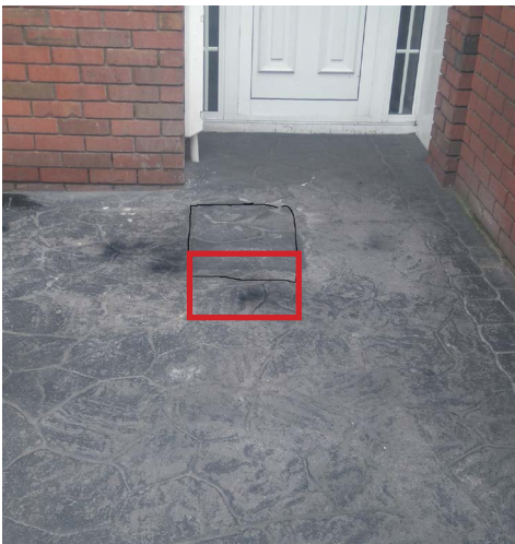
Aischur sealadach ar choincréit phriontáilte.

Má dhéantar dochar do na limistéir fhéir le linn na hoibre tochailte, déanfaidh ár bhfoireann a ndícheall iad a dheisiú, ag déanamh athshíolaithe san áireamh, más gá sin. Is féidir go gcuirfear moill ar dheisithe ar cheapacha bláthanna agus ar limistéir fhéir mar gheall ar fhachtóirí séasúracha.