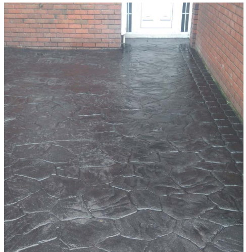
Aischur buan ar choincréit phriontáilte.