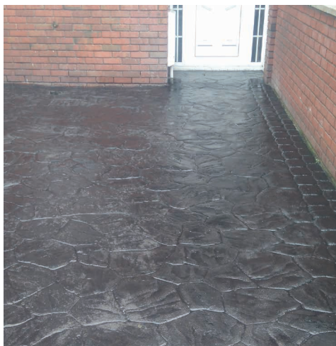
Trwałe odtworzenie na betonie drukowanym.