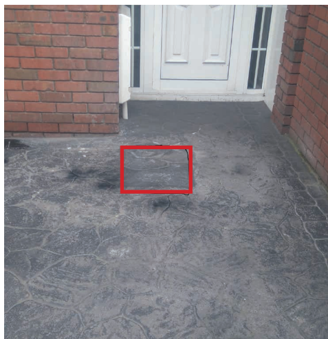
Tymczasowe odtworzenie na betonie drukowanym.

Jeśli trawniki zostaną naruszone w trakcie wykonywania wykopów, nasza ekipa podejmie próbę ich naprawienia, łącznie z ponownym obsianiem. Naprawy klombów i trawników mogą się przedłużyć ze względu na czynniki sezonowe.