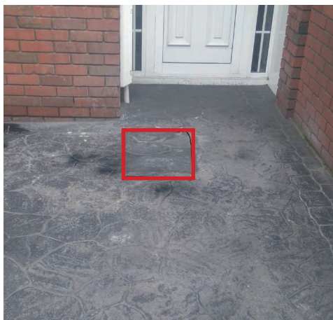
Временное восстановление на печатном бетоне.

«Газовые сети Ирландия» приложит все усилия для того, чтобы не повредить цветочные клумбы и газоны на вашей территории. Вместе с вами мы выберем лучший путь, чтобы избежать повреждения растений, цветов и газонов. Но, возможно, вы предпочтете временно удалить растения или цветы, во избежание ущерба вследствие непредвиденных обстоятельств. Мы с должным вниманием отнесемся к покрытым растительностью участкам, однако, избежать вытаптывания на лужайке или по краям не удастся, особенно, при плохой погоде. Если в ходе земляных работ пострадают участки, покрытые растительностью, наши сотрудники предпримут все необходимое для восстановления и даже засеют заново, если потребуется. Восстановление цветочных клумб и лужаек может быть отложено в связи с сезонными факторами.