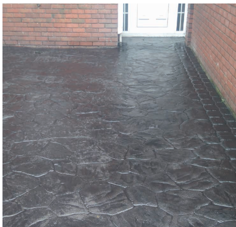
Постоянное восстановление на печатном бетоне.